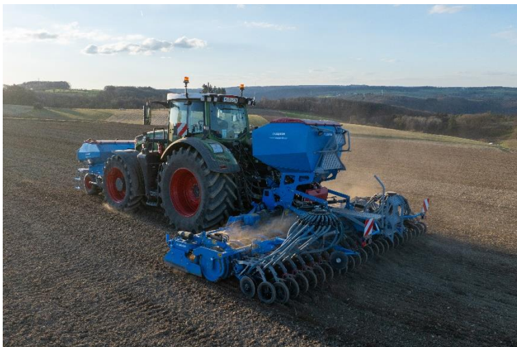
Фото 1: Активна підготовка посівного ложа та встановлений у задній частині бункер для насіння роблять LEMKEN Solitair MF унікальною у цьому сегменті робочої ширини.