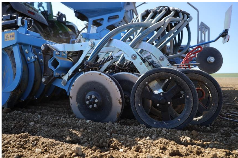
Фото 3: Транспортне опорне колесо підвищує безпеку під час транспортування по дорозі.

Фото 2: Серцевиною сівалки є сошкова балка OptiDisc з паралелограмними подвійними дисковими сошниками OptiDisc M, що не потребує обслуговування.